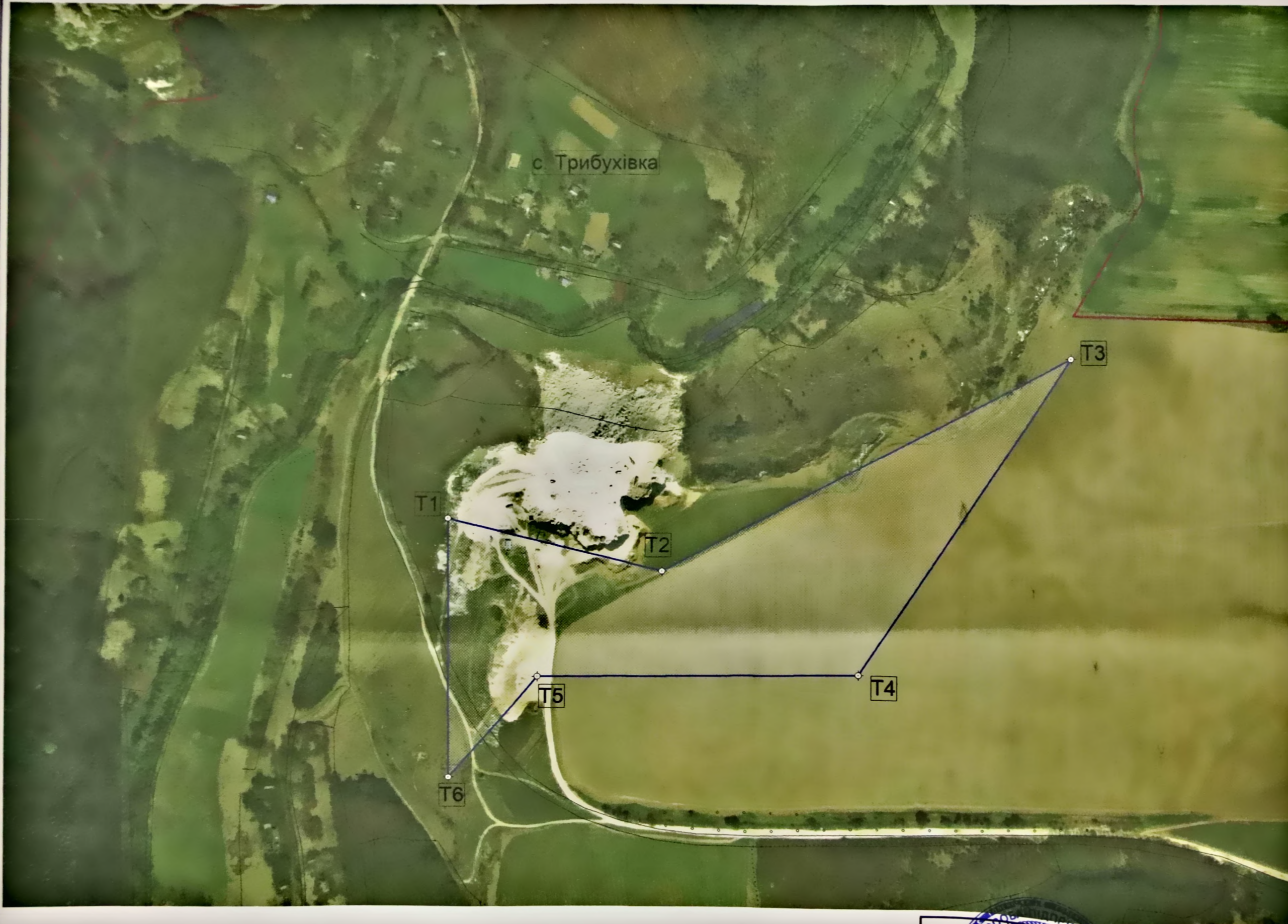
Географічні координати кутових точок