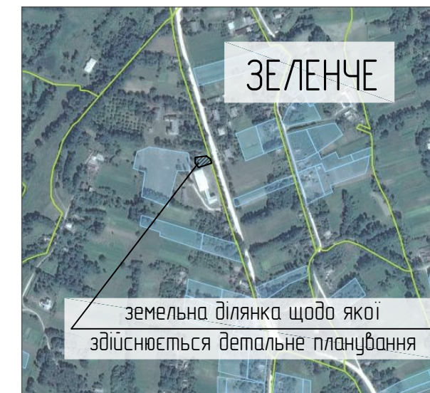
Схема виконана на вкопюванні з кадастрової карти України