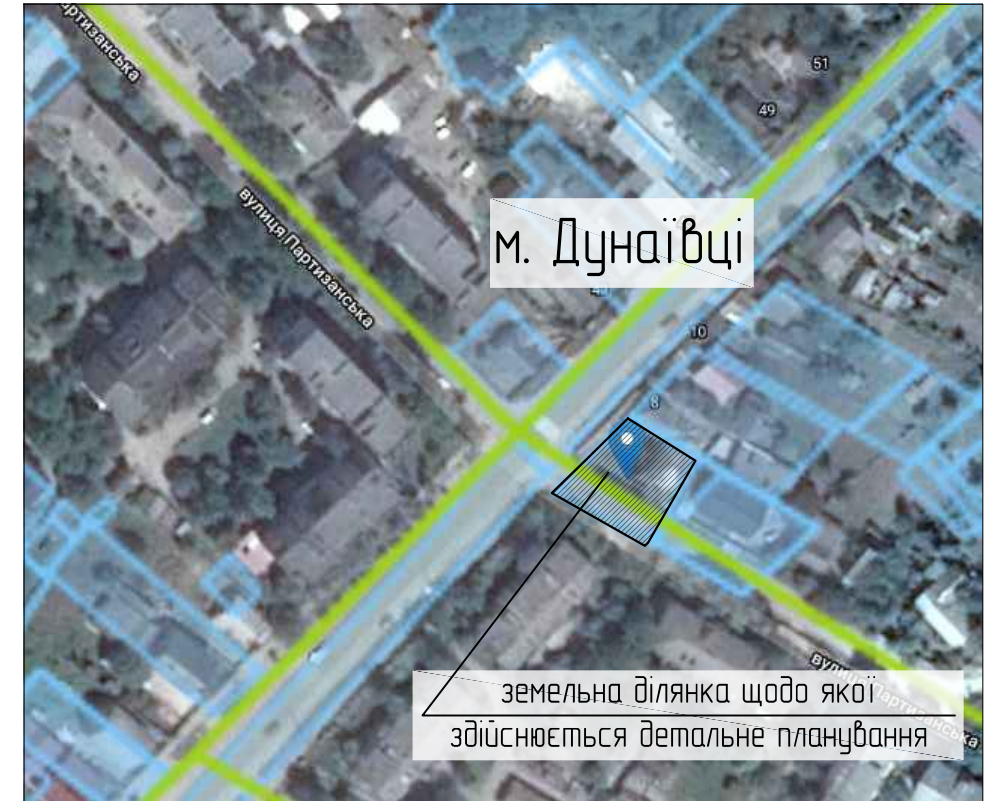
Схема виконана на вкопюванні з кадастрової карти України